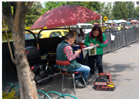
Acciones pedagógicas en Separación y Manejo de residuos sólidos- comunidad en general

Lo anterior, con el objetivo de fomentar una cultura ciudadana orientada al consumo responsable y al manejo adecuado de los residuos. Además, se busca informar sobre los horarios y días establecidos para la disposición y correcta segregación de los residuos, partiendo de la identificación de diferentes puntos críticos en la ciudad de Bogotá y haciendo especial presencia en las zonas comerciales donde se presentan situaciones ambientales conflictivas asociadas a la mala disposición de residuos en los contenedores y canecas destinadas para tal fin.